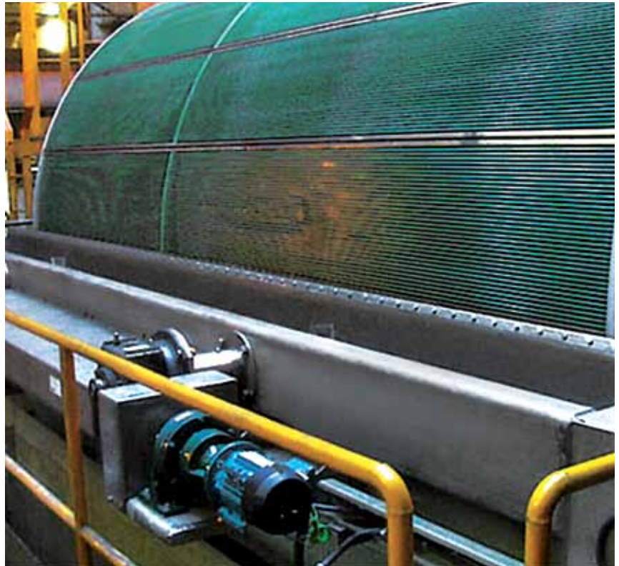
Filtro a tamburo