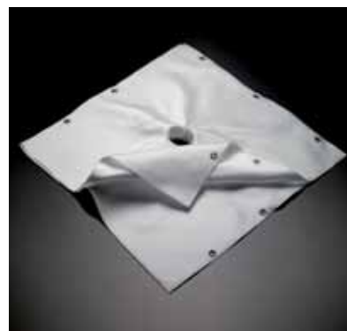
Tela filtrante per filtropresse