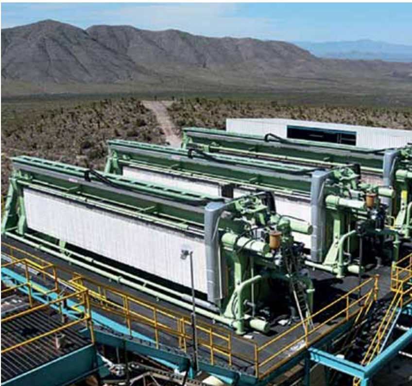
Filtro pressa

I fanghi derivanti dal trattamento possono a volte essere destinati alla termovalorizzazione; in tali casi i fumi vengono neutralizzati e depolverizzati con filtri a maniche.