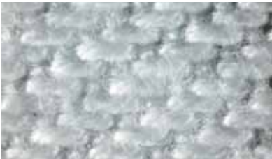
Tessuto in filato di fiocco