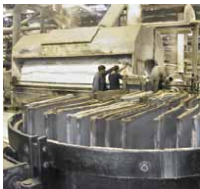
Filtro a foglia